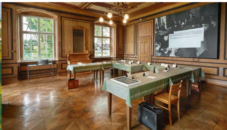
La salle où fut élaborée la Constitution de 1948 présente les personnages et les thèmes abordés par la loi fondamentale allemande.