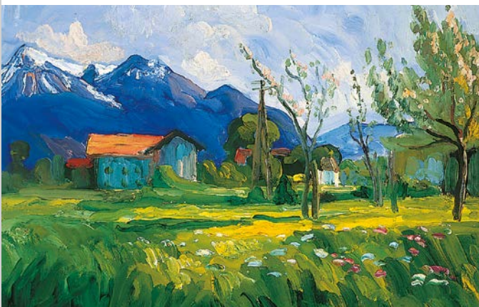
Julius Exter (1863–1939) a peint de nombreuses vues du piémont bavarois. Ci-dessous : Le Printemps (1920/25)

C'est sur l'île d'Herrenchiemsee que fut construit le premier couvent Bavière. Sa collégiale devint cathédrale en 1216 lors de la création de l'évêché de Chiemsee. Les bâtiments actuels datent toutefois des XVII e et XVIII e siècles. L'île échut à un particulier après la sécularisation des biens du clergé en 1807 et de la suppression de l'évêché l'année suivante, l'église étant alors transformée en brasserie. Le roi Louis II l'acheta en 1873 et se fit aménager des appartements dans l'ancien couvent, désormais appelé « le vieux château ». Transformés en musée en 1989, ces bâtiments permettent d'apprécier